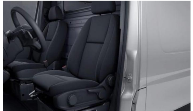
Komfort-Fahrersitz - (SB1)