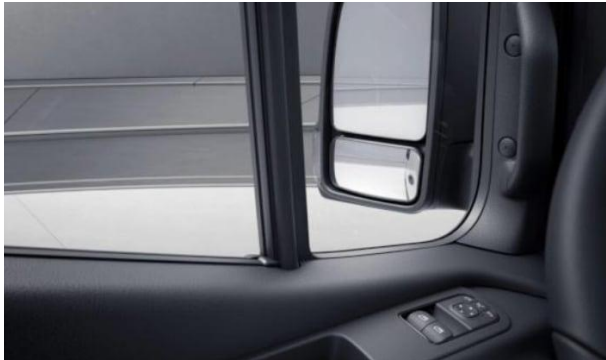
Außenspiegel heizbar und elektrisch verstellbar - (F68)